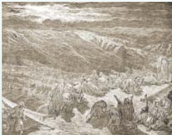
Dios les ofreció a los israelitas una relación directa con él, pero ellos prefirieron alejarse de su Creador.

ra a su compañero” (Éxodo 33:11). Dios deseaba cultivar este tipo de relación con los israelitas. Leamos lo que pasó, según escribió más tarde el propio Moisés: “Cara a cara habló el Eterno con vosotros en el monte de en medio del fuego. Yo estaba entonces entre el Eterno y vosotros, para declararos la palabra del Eterno; porque vosotros tuvisteis temor del fuego, y no subisteis al monte” (Deuteronomio 5:4-5).