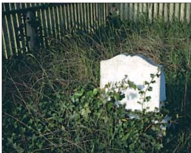
¿Es nuestra existencia tan sólo un momento pasajero en medio de una eterna vacuidad, sin sentido ni propósito alguno?

Cuando uno hace a un lado la perspectiva y esperanza de una vida futura, su vida queda sin valor ni propósito. ¿Qué diferencia habría finalmente en que viviéramos como una madre Teresa o un Adolfo Hitler? El destino de todos sería el mismo. Las buenas obras de la gente no afectarían de ninguna forma su destino o el