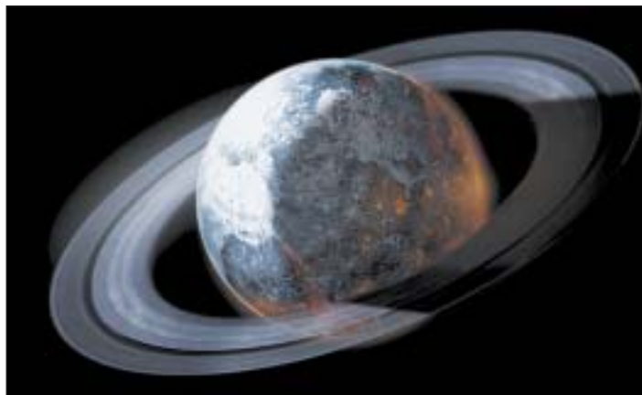
El hombre sigue descubriendo nuevas maravillas en el cosmos, pero éstas siempre están gobernadas por leyes precisas.

Semejantes descubrimientos y conclusiones científicas nos traen una vez más a