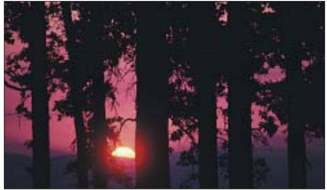
¿Puede la teoría darwiniana explicar la existencia de la asombrosa variedad de vida que hay en nuestro planeta? Y si