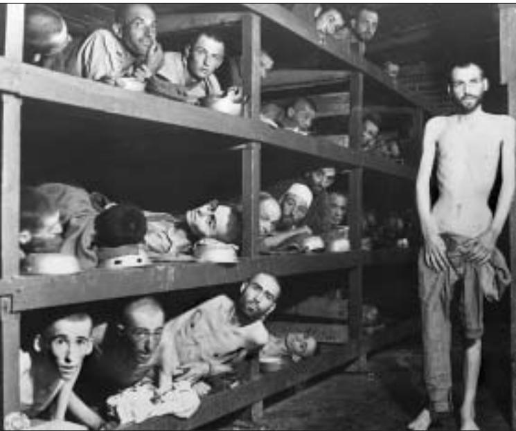
El movimiento anti-Dios, que echó raíces en el siglo 19, dio su amargo fruto en el siglo 20 con dos guerras mundiales, el surgimiento del comunismo ateo y la mórbida y despiadada crueldad de los hombres contra sus semejantes.

en cuenta a Dios, Dios los entregó a una mente reprobada, para hacer cosas que no convienen; estando atestados de toda injusticia, fornicación, perversidad, avaricia, maldad; llenos de envidia, homicidios,