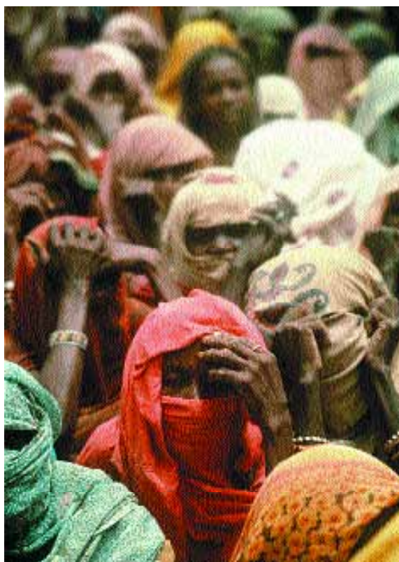
"Habrá pestes y hambres . . .", dijo Jesús al nombrar las condiciones que existirían antes de su retorno. En esta foto etíopes desnutridos acuden para recibir alimentos en un campamento de refugiados.

¿Qué tiene que ver todo esto con la profecía? Primero, según lo que se nos describe en el Apocalipsis, en el tiempo del fin un enorme ejército procedente del oriente del río Éufrates cruzará el río para desencadenar una guerra mundial