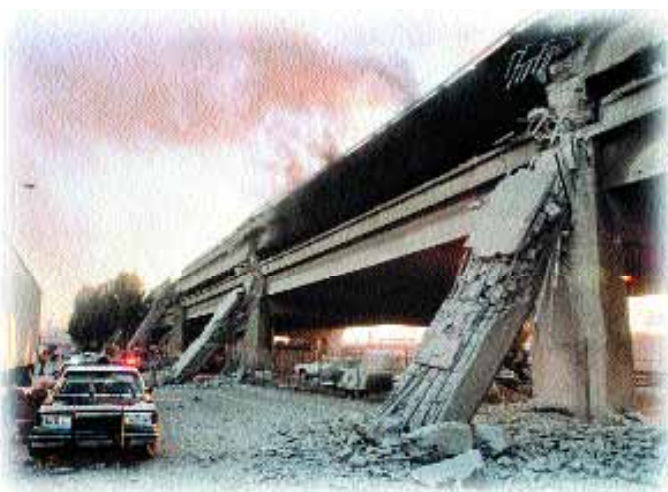
Jesús predijo que ocurrirían “terremotos en diferentes lugares”, y dijo: “Todo esto será principio de dolores”.

A medida que se intensifique la intolerancia, las personas se sentirán más asustadas y se entregarán unas a otras. En un ambiente de creciente maldad y hostilidad, la gente perderá la solidaridad y dejará de obedecer a Dios. El diablo, lanzado a la tierra y sabiendo que tiene poco tiempo (Apocalipsis 12:12-17), tratará por todos los medios de frustrar los planes de Dios.