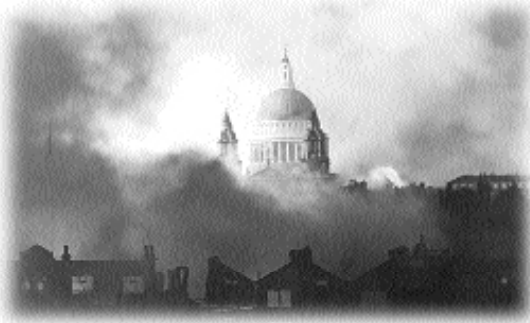
El azote de la guerra y la amenaza de la extinción del género humano continuarán hasta que Jesucristo retorne y establezca su reinado de paz.

Como resultado de todas estas cosas tan terribles, aquellos que sobrevivan serán humillados hasta el punto de que finalmente se arrepentirán y aceptarán la promesa de nuestro Creador de un futuro maravilloso en un mundo que excede nuestra capacidad de imaginación. Entonces se cumplirán en toda su magnitud las profecías antiguas acerca de un mundo utópico de paz, salud y bienestar. □