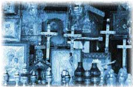
Jesús les previno a sus seguidores del engaño religioso de parte de quienes enseñaran el error, aun usando el nombre de Cristo.

Si el ritmo de crecimiento continúa tal como está, la población mundial se duplicará en unos 50 años. Lo que más preocupa a los dirigentes mundiales y a las organizaciones es que la